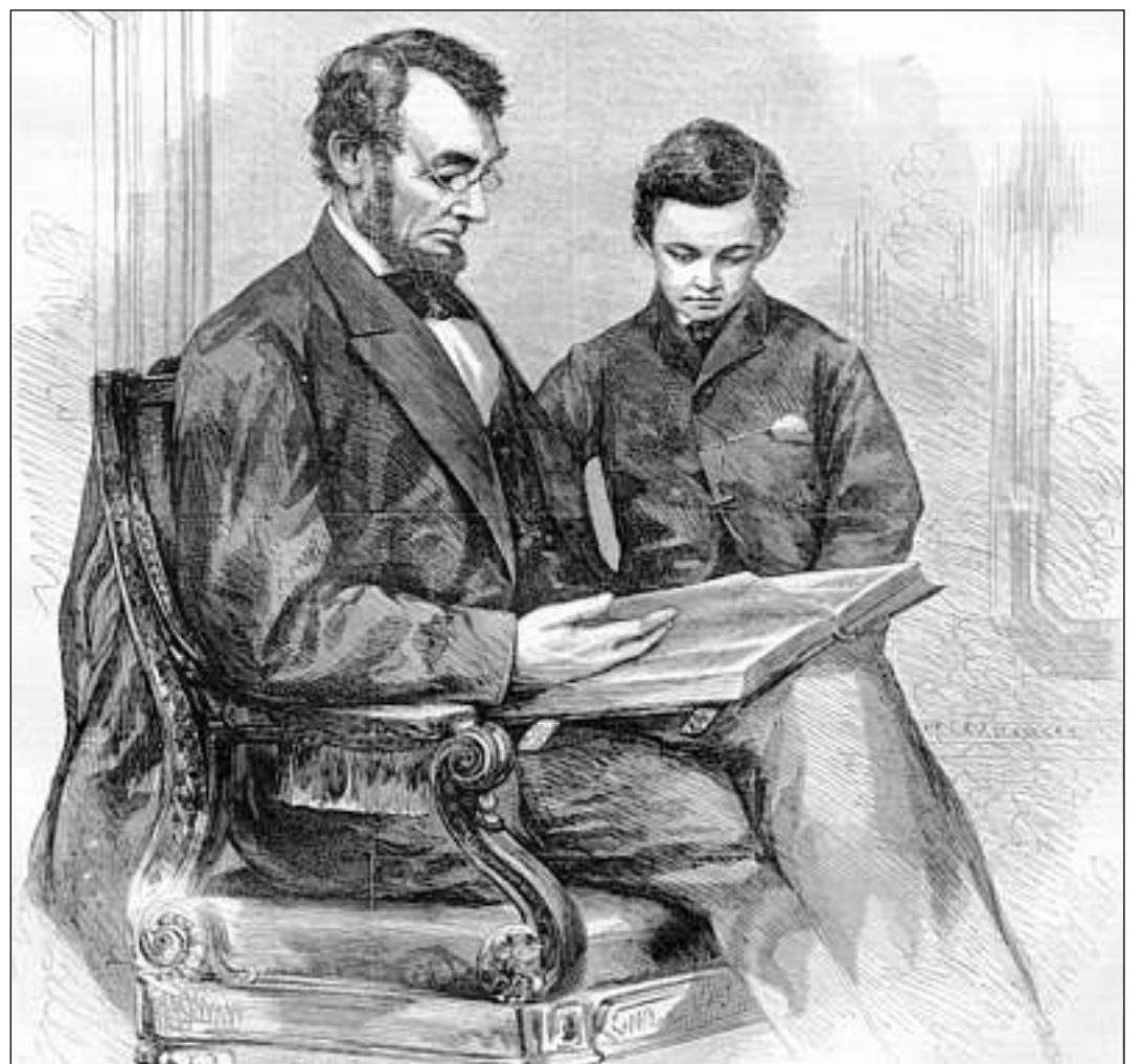
Lincoln cun ses figl. La guerra civila en l'America è stada ina da las pli sanguinas accziuns da l'istorgia mundiala.