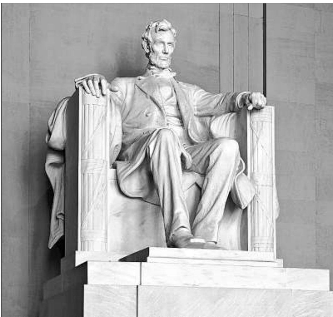
Ad Abraham Lincoln èsi reussi da mantegnair l'Unitad da l'America.

En il center da la prestaziun da Lincoln stat il mantegniment da l'unitad americana. Sco schefcumandant cun in'immensa resoluzezza e sang fraid ha el adina danovamain dirigi e per finir era guadagnà la guerra. Igl è senza dubi l'ovra fundamentala dad Abraham Lincoln che l'America sco suletta pussanza mundiala dominescha per gronda part nus e l'entir mund e che n'existan betg duas forzas mesaunas en l'America dal nord sco la Brasilia e l'Argentina en l'America dal sid.