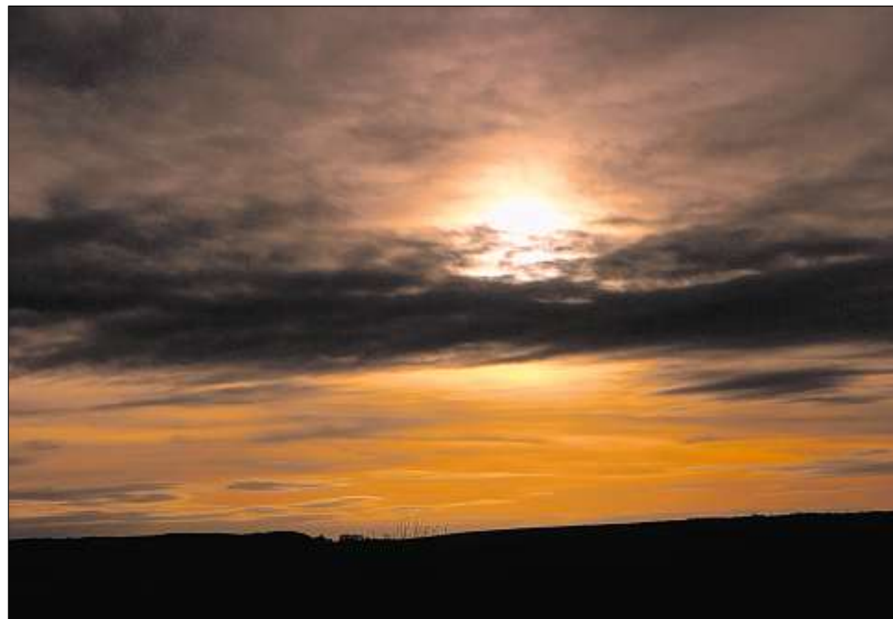
La curiusa rendida da sulegl inquietescha aug Conny.