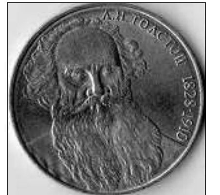
In rubel da l'Uniuon sovietica 1988 cun il purret da Leo Tolstoi.