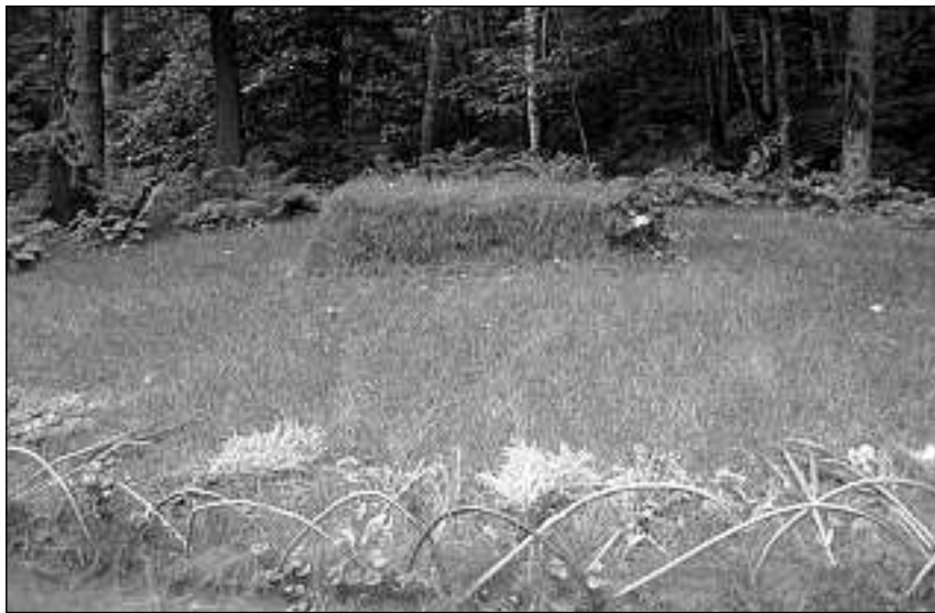
La fossa da Leo Tolstoi a Jasnaja Poljana.