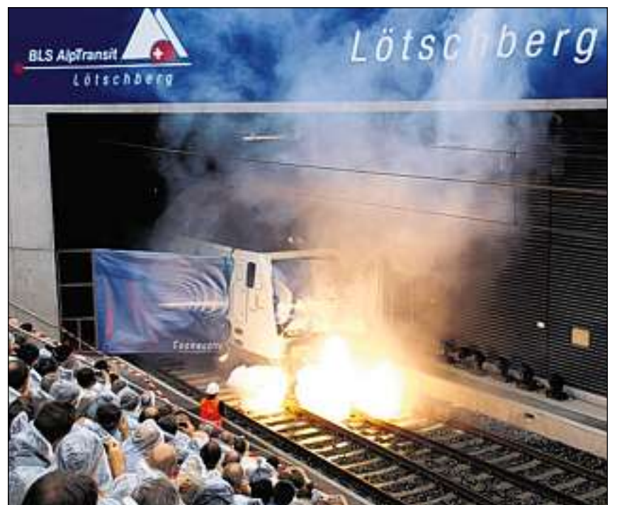
Avertura dal tunnel dal Lötschberg (2007).

Or da questa fermada d'urgenza è naschida l'idea da crear ina staziun sutterrana permanenta e da laschar fermar là ils trens che curseschon tras il tunnel.