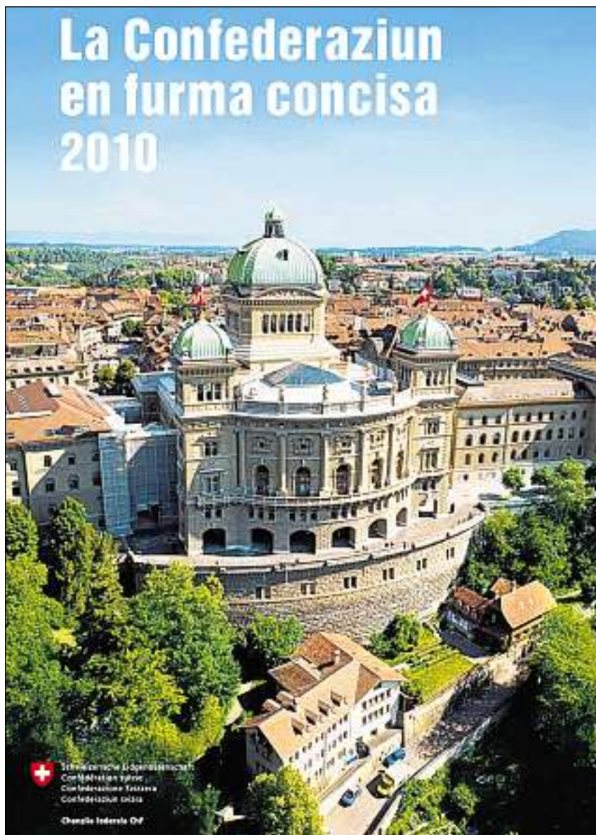
Cuverta da la brochura «La Confederaziun en furma concisa 2010».

La pli pitschna unitad politica en Svizra è la vischnanca. Actualmain (stadi: 01/01/2010) datti 2596 da quellas. Lur dumber sa reducescha dentant cuntinuadamain, perquai che surtut las pli pitschnas vischnancas fusiuneschan per pudair ademplir meglier las incumbensas. Var in tschintgavel da las vischnancas ha in agen parlament – surtut las citads; quatter tschintgavels enconuschan percenter anc la decisiun democratica directa a las radunanzas communalas. Davart il grad d'autonomia da las vischnancas decidan ils singuls chantuns –