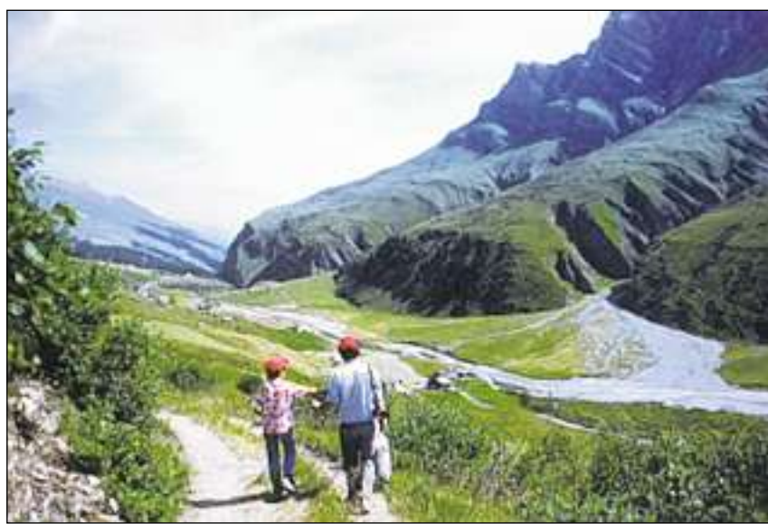
Vista sin la Val Stussavgia sura cun Turrahus ed il dragon da la Rabiusa.

Per la tura da circa duas uras lung il Per-corso Aventura da Malögia al Läggh da Bi-tabergh recumonda il biro da turissem ina vegliadetgna minimala dad indesch onns. Obligatori è il crutsch da carabina, cun il qual ins sto sa segirar dapertut. Sin la via