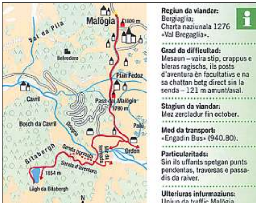
Ina charta geografica ed infurmaziuns utilas davart la singulas tura accumpognan ils viandants.