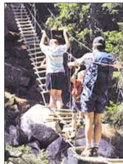
Ils pitschens Indiana Jones a Malögia.

dal Pass da Malögia van ins fin a l'empri-ma storta a piz. Là suond'ins ina senda stretga che maina sur in crest fin a las cha-sas d'Orden. Il percurs d'aventura cumen-za davos il mir da fermada che duai prote-ger la Bregaglia cunter auas grondas e de-vastaziuns. Da l'atra vart dal mir scuvr'ins l'emprim post – ina punt pendent da lain. Suenter ston ils uffants chattar la senda zuppada en il guaud. Tar il segund post ston ins traversar ina suga d'atschal ch'è stendida tranter duas plantas. Là è la tschinta da segirezza obligatorica. Ed en-avant vai al proximi post! La spassegiada ha in grad da difficultad mesaun. Per part è la senda vaira stipa e crappusa. Ils posts d'aventura – punts pendentas, traversas e passadis da raiver – che na sa chattan betg direct sin la senda «normala» èn però facul-tativs e pon vegnir sviads.