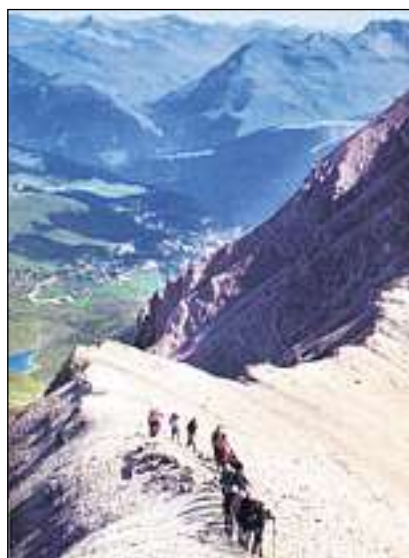
Dal Corn cotschen a la Chamona dal Hörnli.