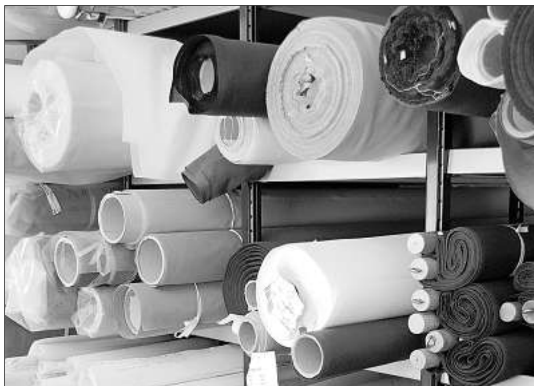
«Fahnen Rohr» lavura be cun tailas e ponn svizzer da qualitad.