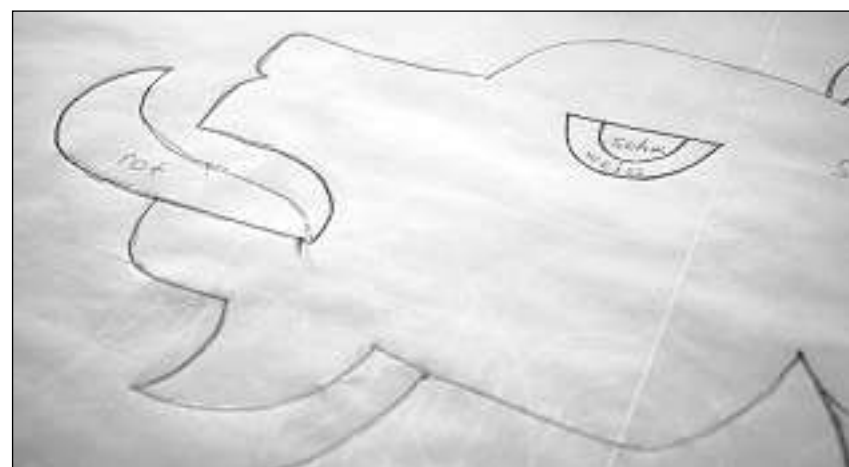
Per l'egl e la lieunga dovri taila d'in outra color.