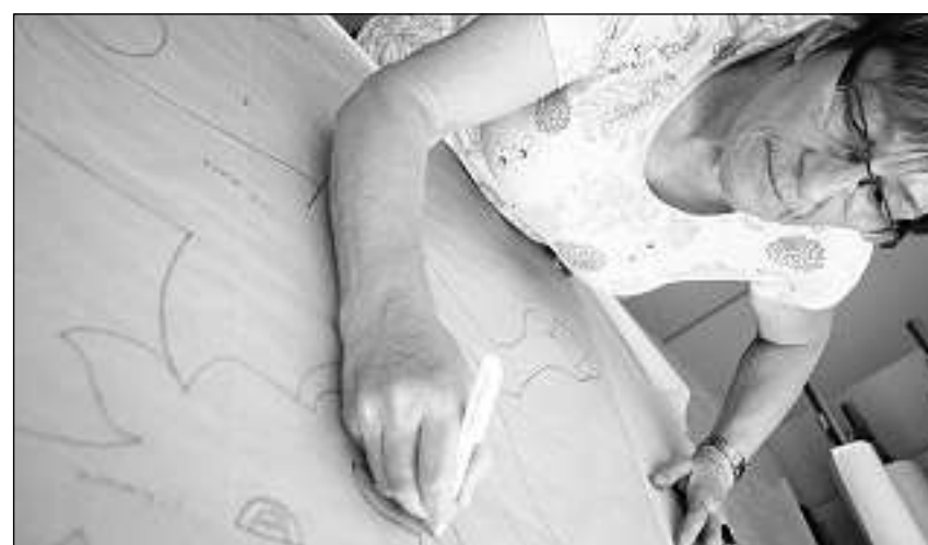
L'emprim vegn il maletg trassegnà sin la taila.

Dapli infurmaziuns chattan ins sin www.fahnen-rohr.ch