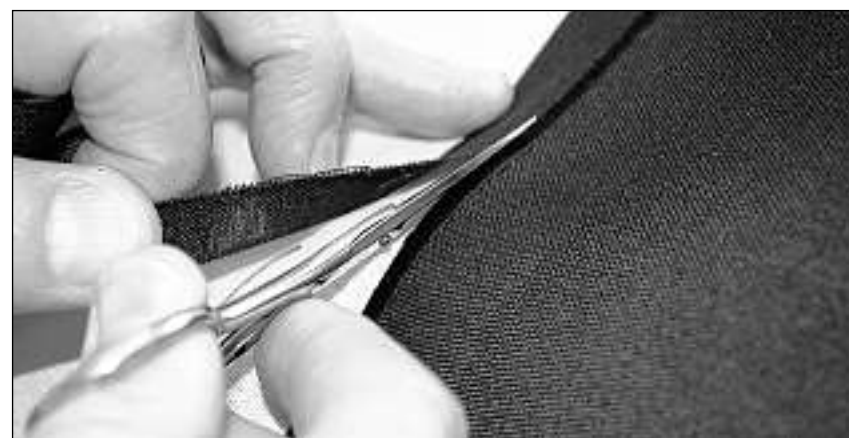
Il funs alv cumpara sut la taila naira ch'ins sto tagliar davent bufatg, senza donnegiar la cusadira.