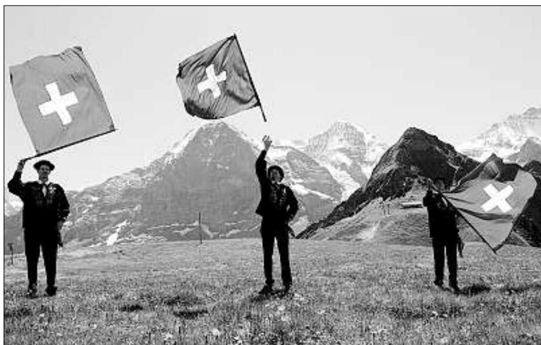
La bandiera svizra – il simbol da noss pajais.