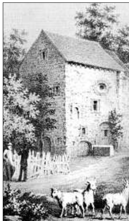
La scola per medischina veterinara a la Engelhalde (1826–1890, avant era ella situada sper l'ospital burgais). Trachsel è s'engaschà fitg per il svilup da questa scola.

Cun fundar ina cassa da spargn vuleva Trachsel encuraschar ils povers e disfortunads da spagnar e cun quai da gidar sasezs. Grazia a sia energia al èsi reussì da fundar il 1835 la cassa da spargn Rüeggisberg (ch'exista anc oz), e quai cun reglas cleras: Il deposit minimal era trais raps, il dabun maximal n'astgava betg surmuntar 1000 vegls francs bernais. Il tschains importava 3 pertschient ed i deva in fond da garanzia da 10 000 francs per sperditas eventualas. Prest 50 onns è Rudolf Trachsel stà president dal cussegl d'administraziun da questa banca piuniera.