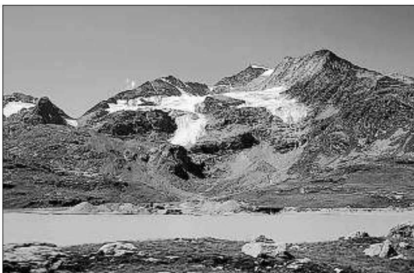
Il Lago Bianco.