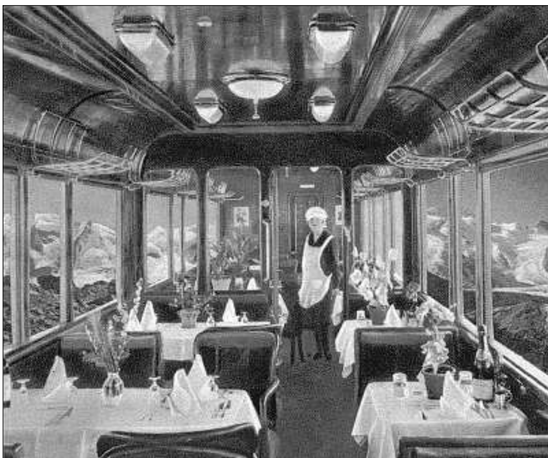
In vagun-restaurant da Mitropa dal 1929 sin l'auitezza dal Pass dal Bernina – il temp da crisa era gist er in temp da fluriziun da las viafiers.

«Via Albula/Bernina – 10 Wanderungen durch das Unesco Welterbe. 224 paginas illustr. ISBN 978-3-7298-1170-6