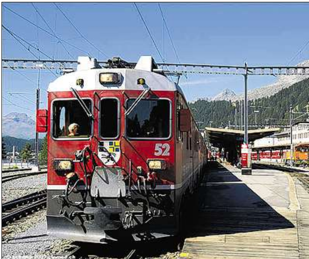
La staziun da San Murezzan cun il tren che parta vers Tirano.