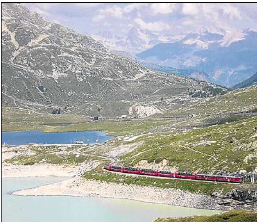
Il Lago Nero davos il Lago Bianco.