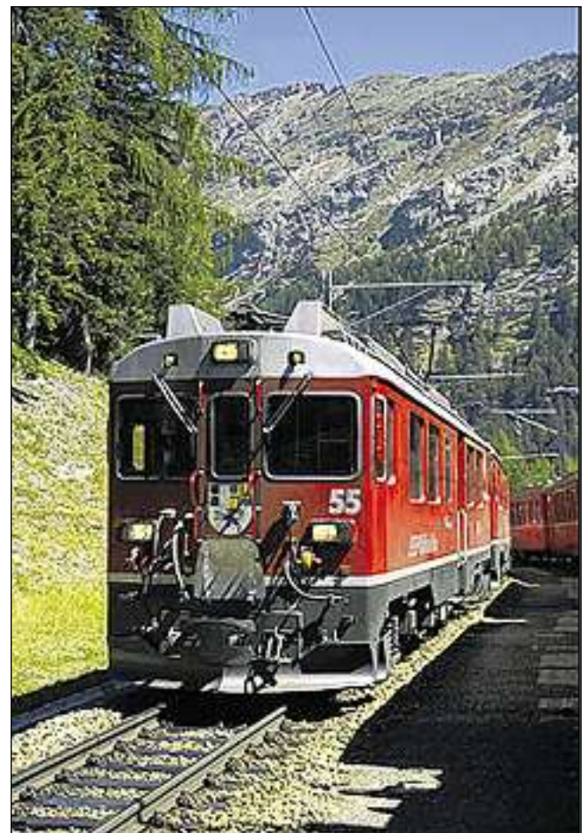
Cruschada da trens.