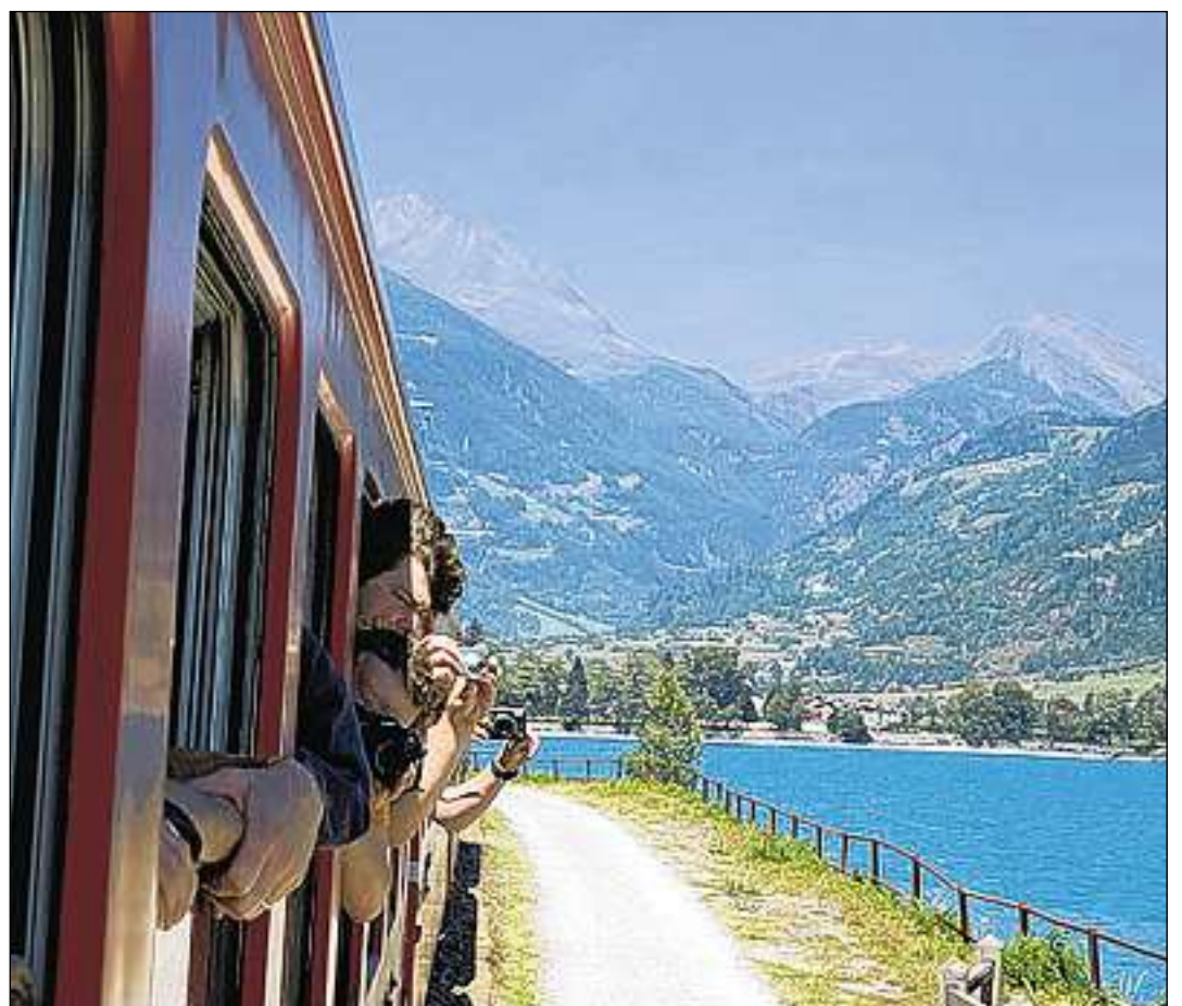
Fascinaziun turistica al Lago di Poschiavo.