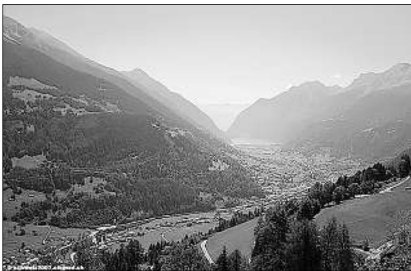
Vista davent da la lingia da viafier sin l'egl blau dal Puschlav, il Lago di Poschiavo.