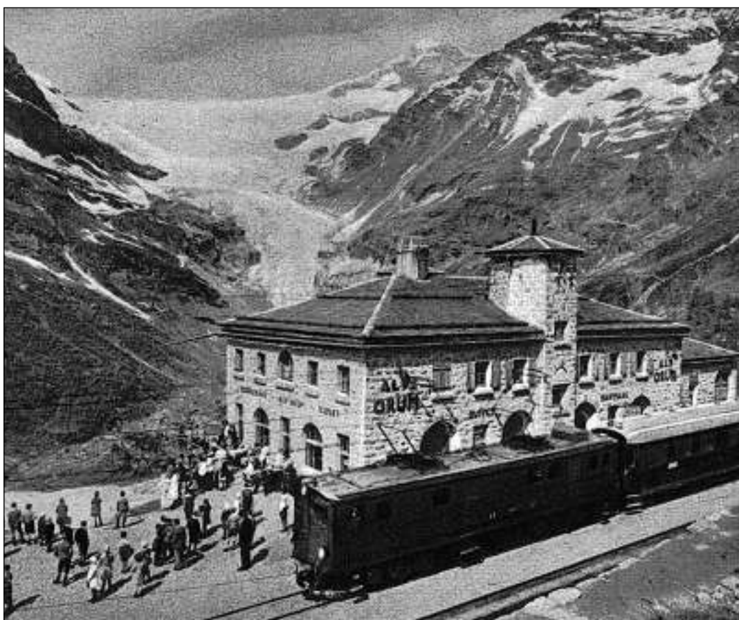
Alp Grüm 1929 – las cascadas da glatsch dal Palü furman ina lieunga fin a l'Alp Palü.