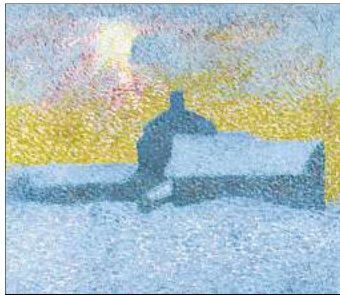
«Enviern a Malògia» (Tschajera d'enviern), 1910.

la glisch ch'in motiv decorativ. Plinavant crai jau che tut la realità haja d'esser en nus sez per pudair viver en nossas ovras. I n'è betg pussibel da picturar il sulegl, sch'ins n'ha betg el en ils eglis u, sche vus vulais uschia, en l'olma.»