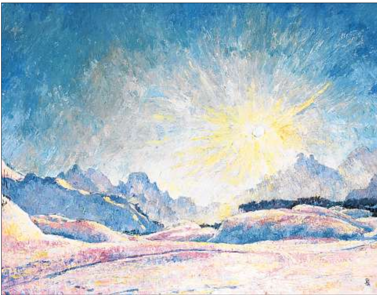
«Sulegl d'enviern sper Malògia», 1926.

L'onn 1900 marida Giovanni Giacometti Annetta Stampa e sa stabilescha a Borgonovo. In onn pli tard na