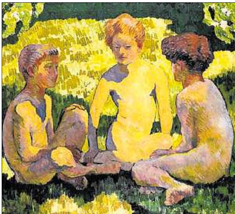
«Fanciulli al sole», 1910.

DEPOSITUM DA LA FUNDAZIUN GOTTFRIED KELLER/MUSEUM D'ART, BERNA