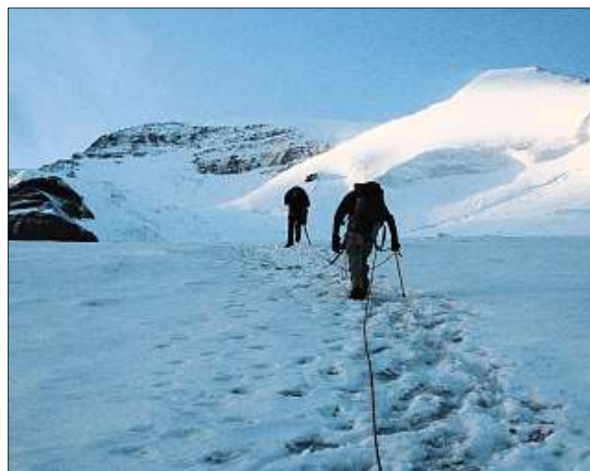
Ascensiun sur naiv e glatschers vers il piz.