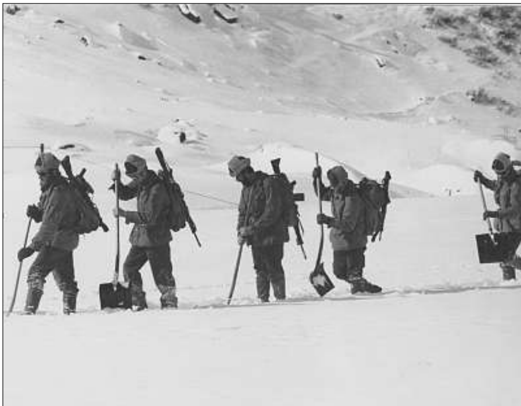
La tecnica da rutnar cumprovada: Avant ch'ìls chavals vegnan en funcziun marchescha ina patruglia da skis il traject ed in detaschament da schuldads cun palas (qua sin la foto) rumpa la cuverta da naiv.