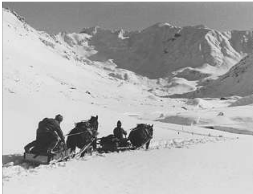
La pista preparada cun chavals e schiitta duess esser pli u main tuttina auta sco la cuverta da naiv circumdanta, per ch'ella na vegnia betg emplenida immediat puspè d'ina burasca. Ella dovra in mantegniment permanent.

Tranter ils infantarists vegn ditg ch'ils berniers dad oz, damai ils commembers dal train, sajan schuldads da buna veglia, forsia in zichel stinads, ma persunter fidads, robusts ed engaschads, u cun auters pleds: Veritabels umens da la natira en unifurma. La savida pratica dominescha la savida teoretica, e la prestaziun vegn avant las furmas militaras. Forsia gist grazia a questa mentalità èn els anc oz capabls da far quai che mo ils berniers eran abels da far pli baud: rumper la muntogna! Donn e putgà che questa savida va forsia a perder per adina!