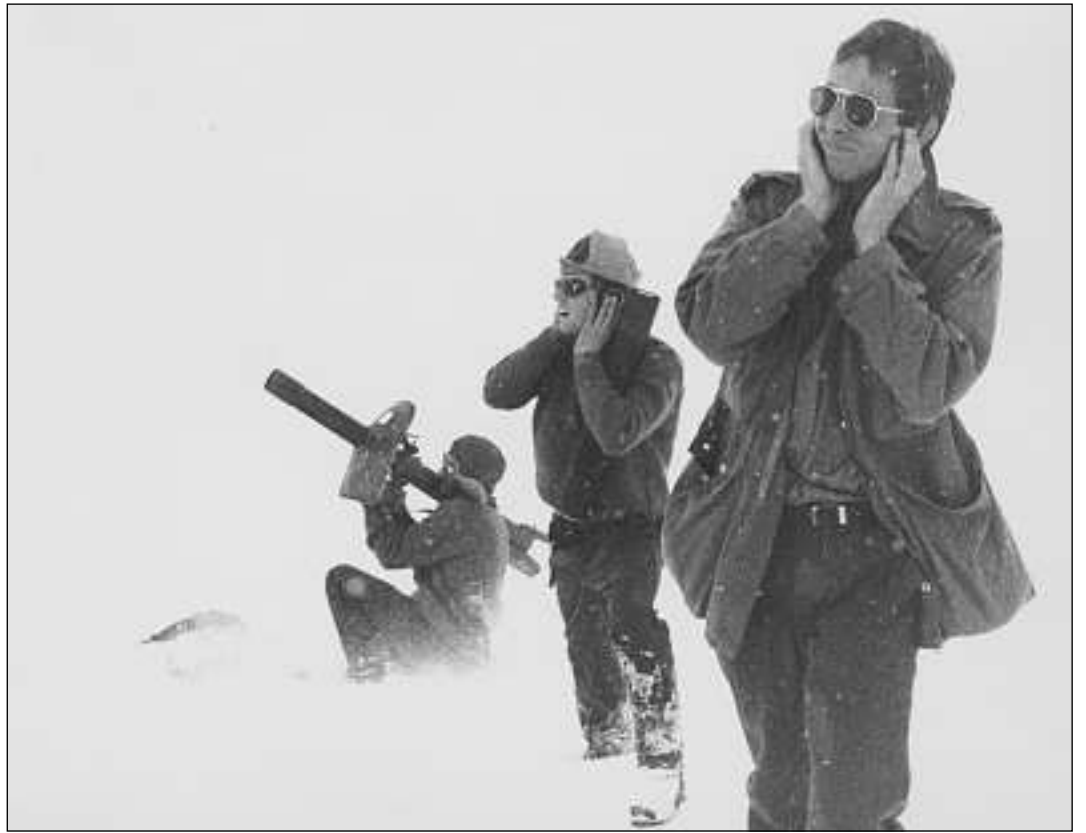
Nagina ristga nunnecessaria: Las lavineras privlusas vegnan siglientadas.