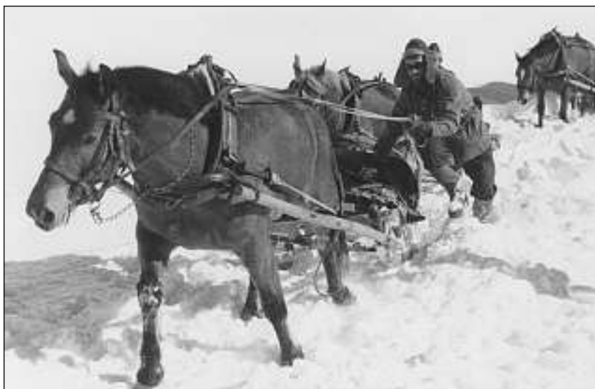
Ìls schlusigls da la schlitta, che vegn duvrada per trassar la senda rutnada, èn liads a travers cun ina chadaina.

Donn ch'igl è ussa mo pli ina dumonda dal temp enfin che l'art sublim da la tecnica da fullar via tras la naiv, damai il rutnar, è istorgia e va complettamain en emblidanza.