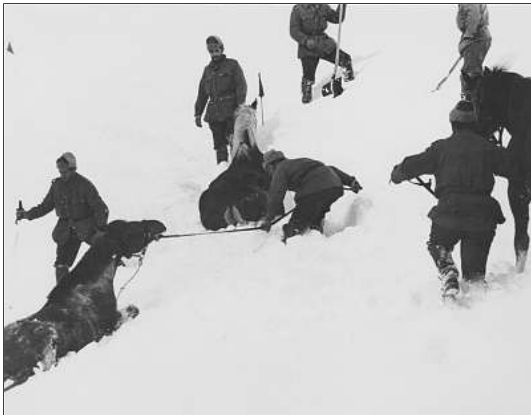
Ìls chavals da rutnar avanzan cun enorms sforzs tras las navaglias. Il chaval davant sto vegnir remplazzà savens tras in auter, perquai che questa lavur sponna talmain.