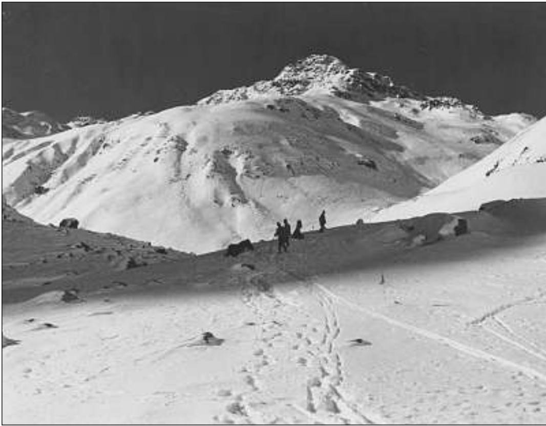
Dira lavur da rutnar en in mund autalpin solitari. Quai ch'ils vegls berniers faschevan pli baud, exerciteschan qua ils schuldads da muntogna ed ils chavals da l'armada.