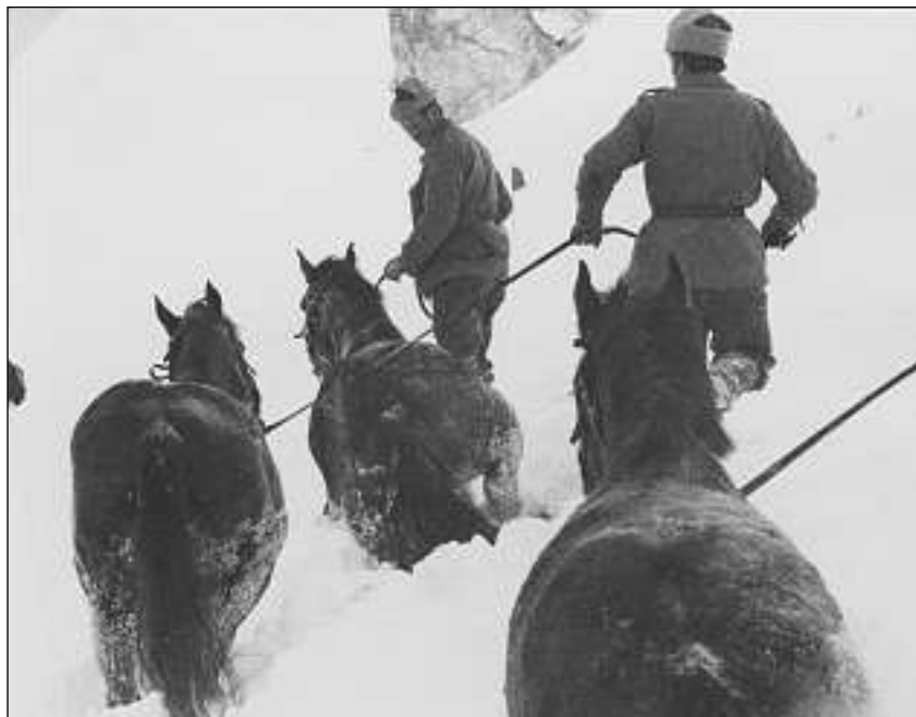
Chavals adattads per far senda en animals ruassavels, robusts e da statura lada. Cun lur pais dal corp splattitschan els la naiv da la senda. Pervi dal privel da sa blessar fan els quai senza fiers-chaval.

Sco quai ch'il chaval è svani plaun a plaun or da l'agricultura, sco unfrenda da la modernisaziun, è el era svani en ratas or da l'armada. Entant che las truppas da train disponivan il 1950 anc da var 10 000 animals, è il dumber sa reduci oz – cun renunziar a las truppas da muntogna – a main che 700. La fin definitiva è probablmain mo ina dumonda dal