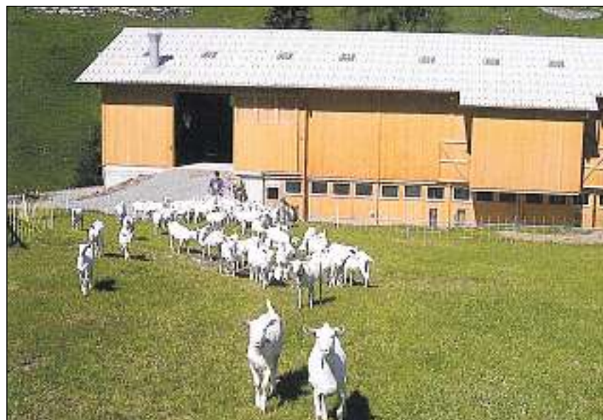
Il tegnair chauras dovra oz in spiert d'interprender

liunà il diavel cun in buc-chaura; en in'otra legenda defenda il buc-chaura sia muntanera e scurrenta il diavel. Er en paraulas e raquints sco 'Il luf ed ils set aniels' dals frars Grimm e 'Zocla, Zila, Zeppla' dad Alois Carigiet giogan las chauras ina rolla impurtanta.