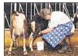
Muntaneras en ils vitgs - oz ina raritad