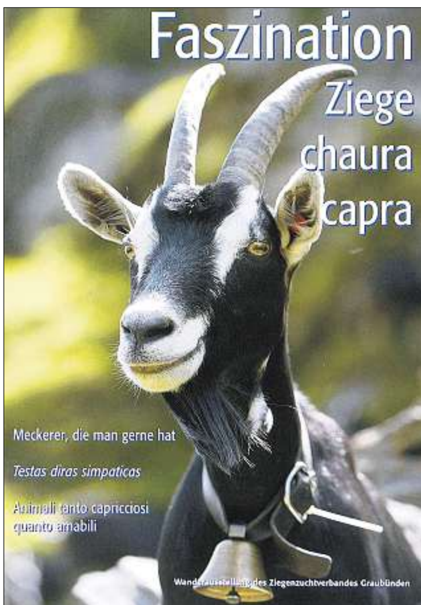
Cuverta da la brochura „Fascinaziun chaura“

Pli baud pasculavan muntaneras da chauras savens er en guauds e chaglias. Cun rusignar vi da las scorsas da planti-