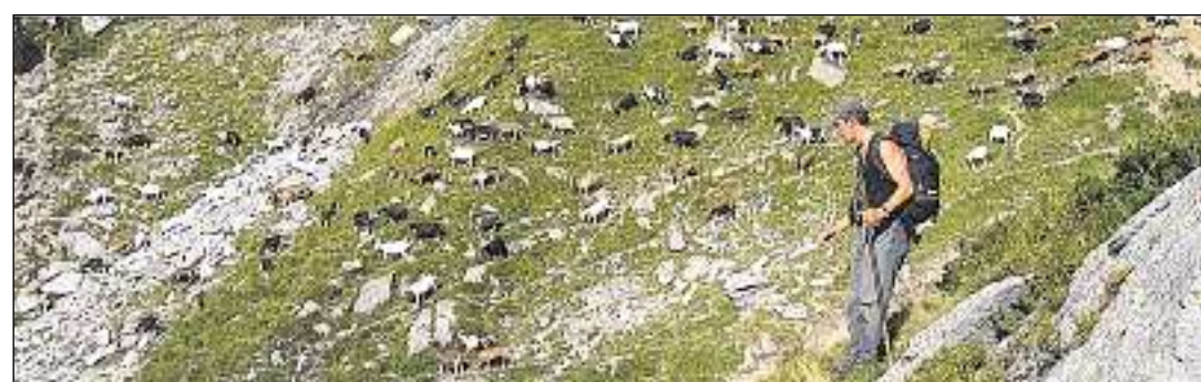
In di cun blera lavur sin l'alp da chauras

nas giuvnas periclitavan ellas il regiuvnament dal guaud. Characteristics eran ils 'pignets da chauras'. Ma las chauras rusignavan era vi da plantas pli grondas. Perquai han ins limità la pasculaziun libra u insumma scumandà d'utilisar las pastgiras en ils guauds.