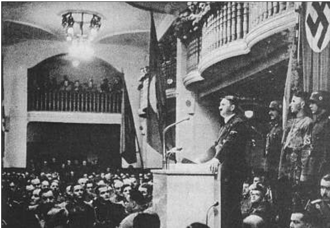
«Bürgerbräukeller» avant l'attentat...