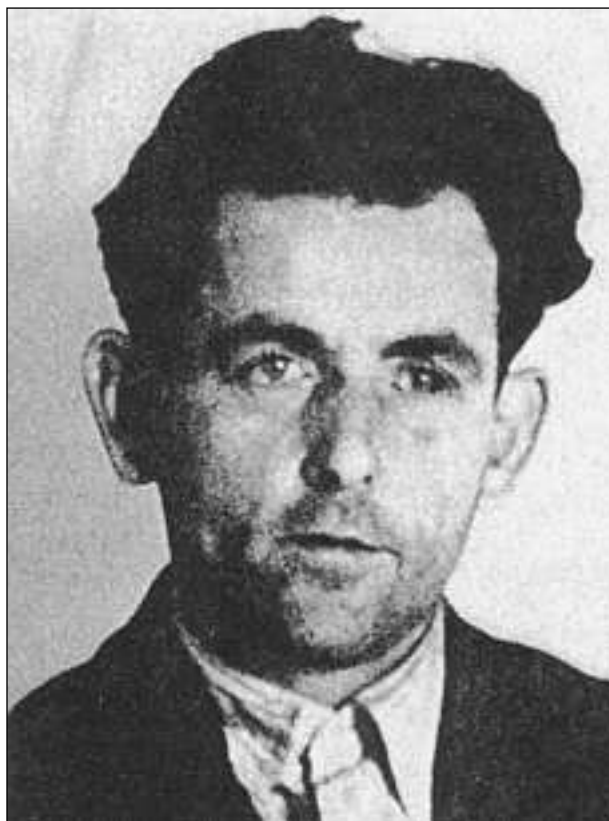
Johann Georg Elser.

Johann Georg Elser è vegnì traplà ed arrestà anc la medema notg, plitost per casualità e curt avant che passar il cunfin svizzer a Kreuzlingen. Ils duaniers al avevan tschiffà pensond ch'el veglia mitschar dal servetsch militar. Cura che la novitad da l'attentat a Minca è alura sa derasada, è era l'arrestà vegnì examinà pli minuziusamain. Utensils da Minca e da la «Hofbräukellerei», sco ina carta postala, han manà ad ina chadaina d'indizis