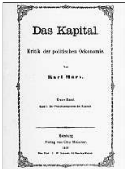
«Il chapital» (scrit en il Museum britannic), frontispizi.