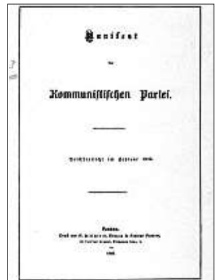
Il «Manifest» da Marx ed Engels, cumpari la saira avant la Revoluziun dal 1848.