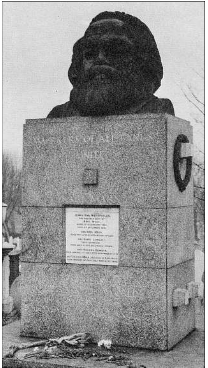
Il monument da fossa per Karl Marx sin il santeri da Highgate (Londra).

Il temp da fluriziun dal marxissem è bain passà oz cun il declin dal sistem sovietic. En il mainstream da l'intelligenza actuala dal vest, u da quai che sa considerescha sco intelligenza, n'èn dentant anc betg svanidas las ideas ed ils slogans dal vocabulari d'antieri comunists barbars e da vegls marxists. Anzi, in marxissem latent è s'uni, sin il nivel ordvart seductiv dal materialissem, a moda sorprendentamain solidarica cun la burgaisia da pli baud, vul dir il chapitalissem.