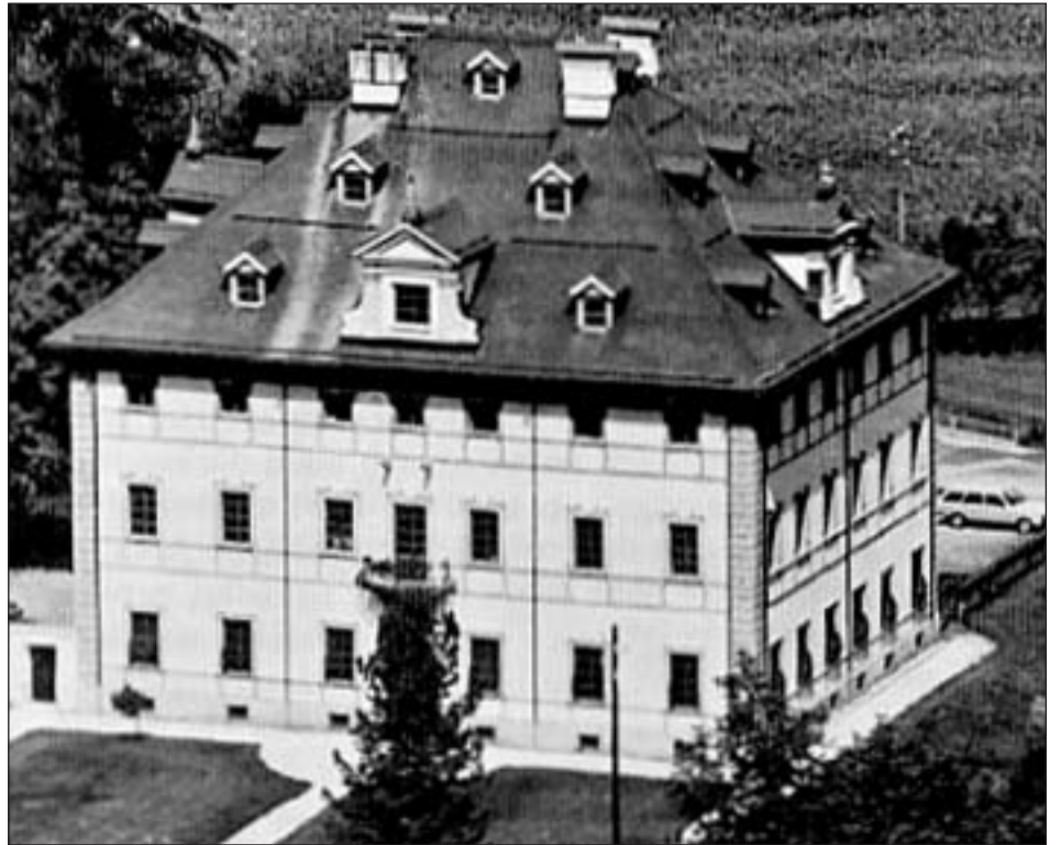
En il Palaz Donat sa chattan la chanzlia communal ed ina part da la scola.