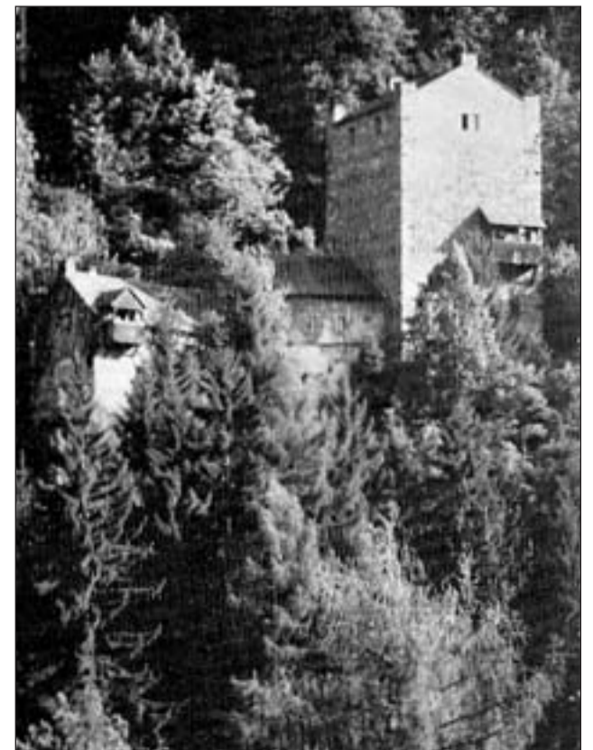
L'imposant chastè Ehrenfels surve-scha sco albiert per juvenils.