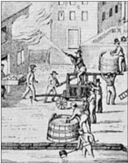
Las squittas da pumpiers a l'entschatta dal 19avel tschientaner eran simplas e savens da lain. L'aua stuev'ins derscher cun sadellas en ina trucla per pudair sprizzar quella sin il fieu. Las squittas stuev'ins piazzar manivel al fieu uschia che quellas brischavan magari.

Fin il 19avel tschientaner discurreva ina gronda part da las abitants e dals abitants da Seglias er rumantsch. Ma già il 1900 devi main che 10% persunas da lingua rumantscha, las qualas eran dal remiment tratgas natiers. L'onn 1920 na discurreva nagin pli rumantsch a Seglias. Pli baud eran immigrads sulettamain ils Rumantschs a Seglias, entant che oz vivan er Talians e Serbs là. 3,3% da la populaziun discurreva serb e 2,8% talian. La lingua uffiziala è il tudestg. Il 2005 dumbrava la vischnanca 854 abitants ed abitants, 749 da quels eran Svizzers. La vischnanca cumpiglia ina surfatscha considerabla da stgars 10 kilometers quadrat. Sper l'agricultura dispona il vitg er da divers implants electricis.