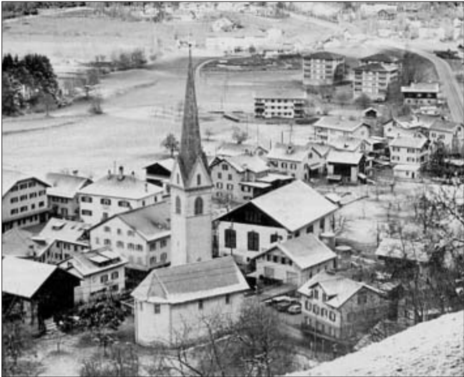
Las chasas veglias ed il coc dal vitg sa gruppeschan enturn la baseglia entant che las chasas novas sa chattan perlung la via da la Tumleasta.