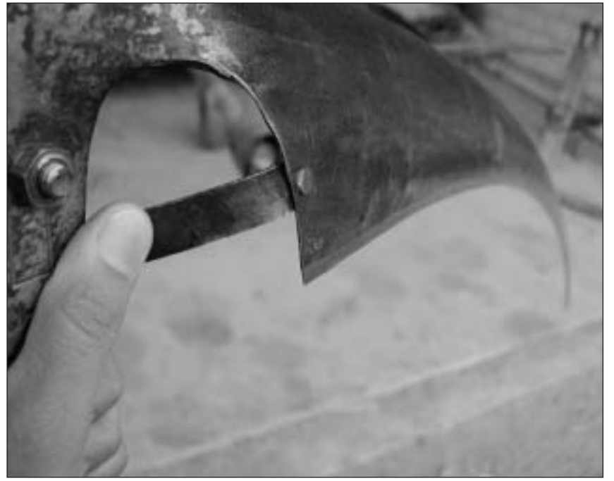
La struba (sanester) ch'ins dovra per fermar il plat numn'ins la «vera».