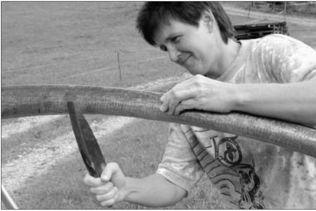
Trair si bain il tagliom cun la cut è il pli impurtant. Uschiglio na tagli betg.