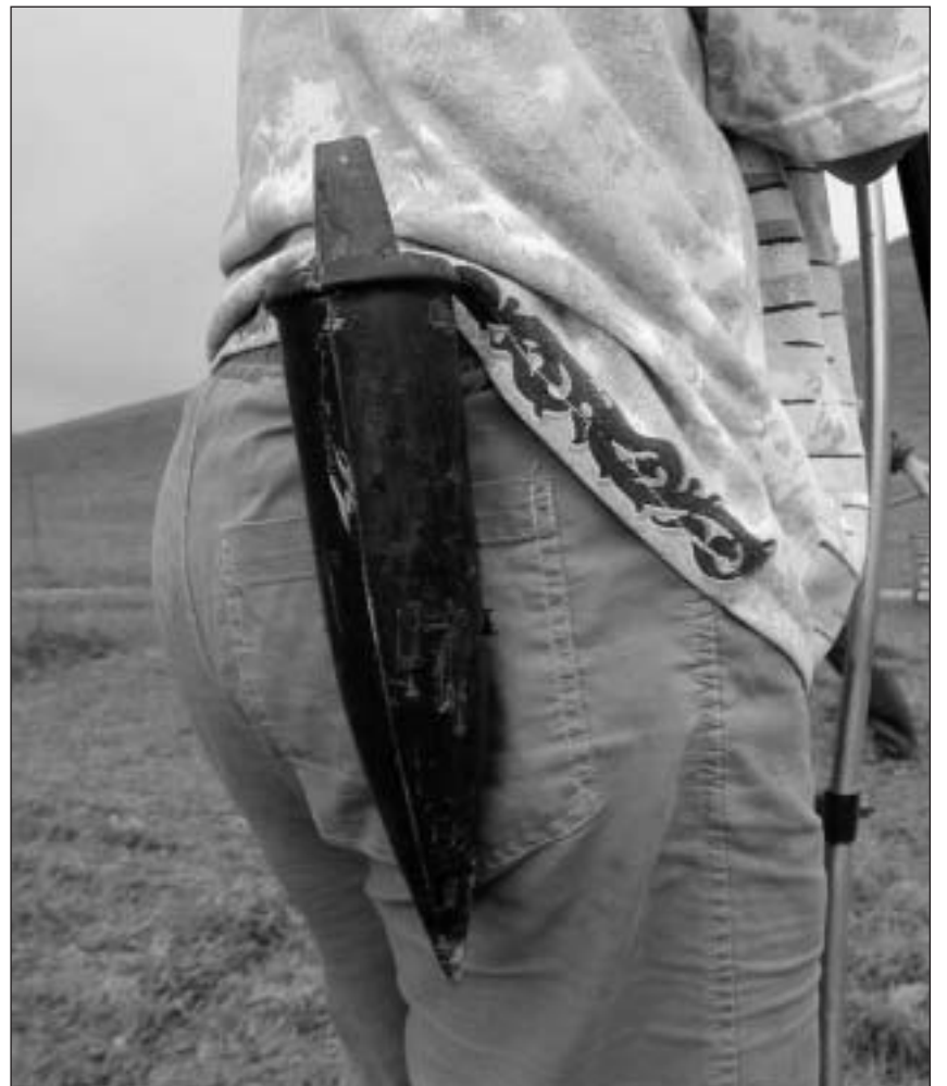
Nagins cumplitgims: Il cuzer penda vi dal satg-tapun.

Batter la fautsch è la lavur da Josef Blöchliger. L'emprim dovra el la maschina da batter. Ma las finessas fa el a maun cun marcladira e martè.