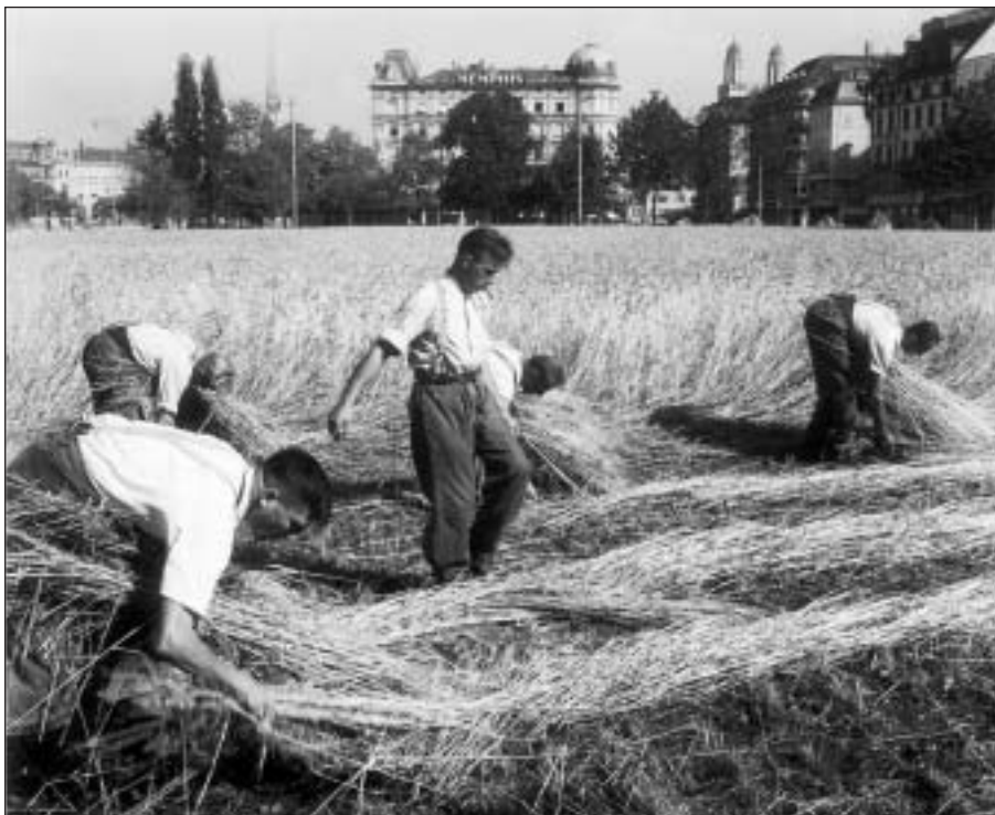
Champ al Bellevue a Turitg: Schizunt en ils parcs vegn cultivà graun per nutrir la populaziun.