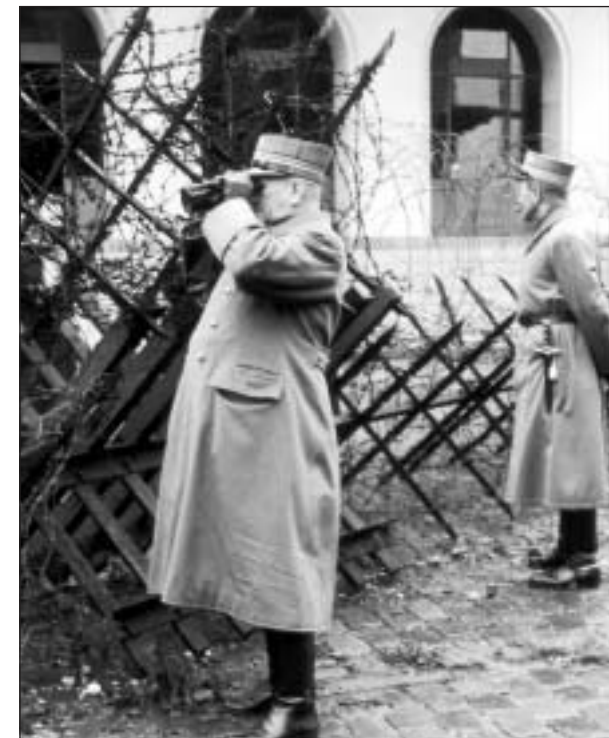
Uffiziers al cunfin durant la guerra.