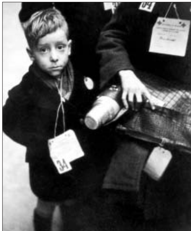
In uffant fugitiv da la Belgia.