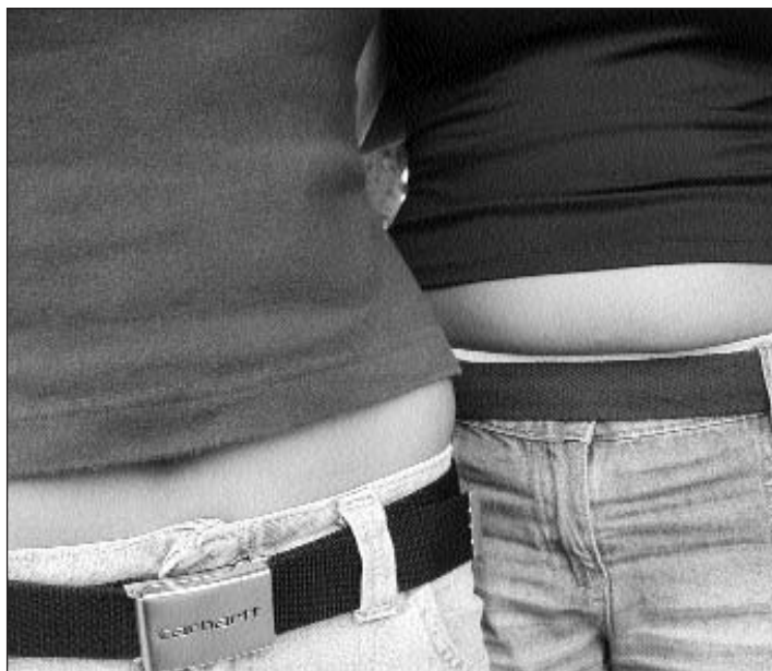
Duas amias.