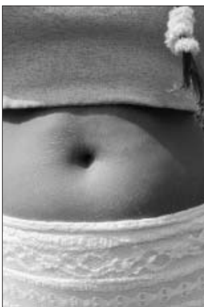
Tut en alv.