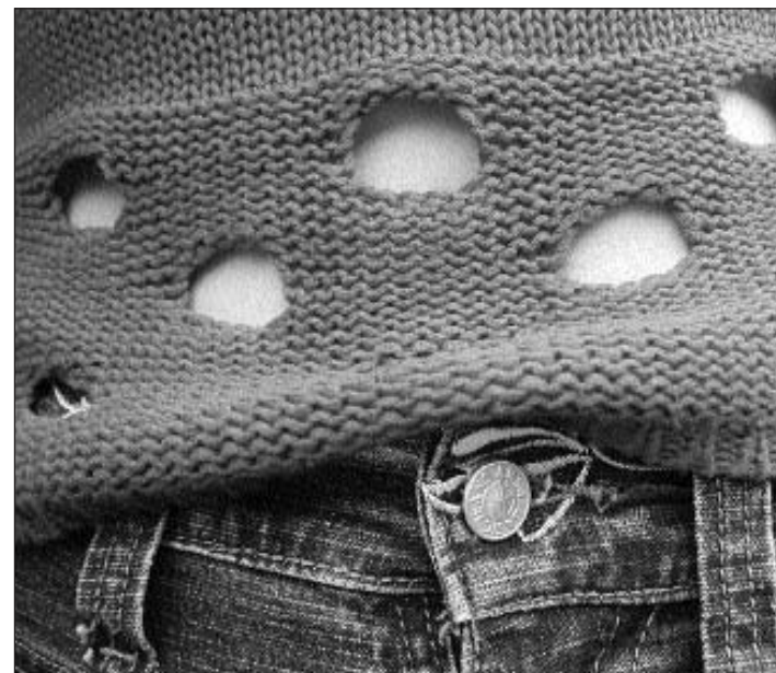
Pli pauc ch'ins vesa, pli interessant ch'igl è.