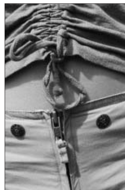
Bindels e maschas fan interessant.