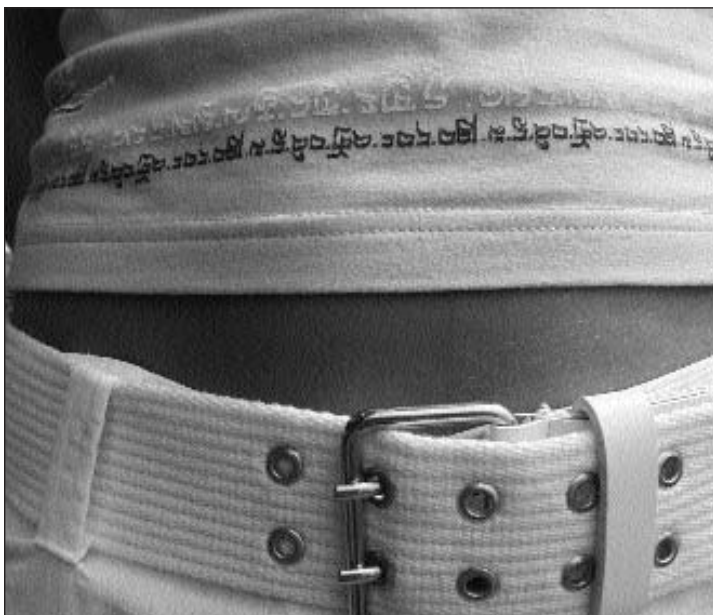
Nua è l'umbli? Sura u sut?