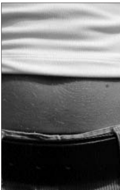
Donn ch'ins vesa betg l'umbli.