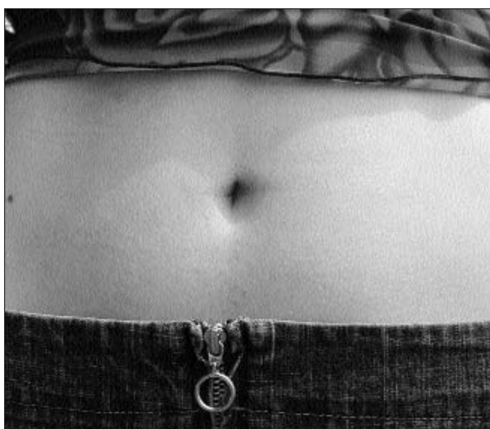
Umblis – quai fiss ina scienza per sasez.