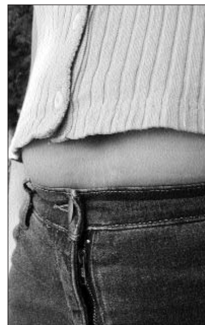
Cun 45 onns dastgass la bulschetta schizunt esser pli grassa.

Pia, allez hop! Ora cun ils venters! Per ch'i dettia ina chauda parada da stad. L'enviern è anc criv e lung avunda.