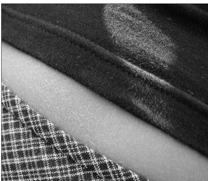
Dus centimeters tranter rassa e t-shirt. Quai basta.