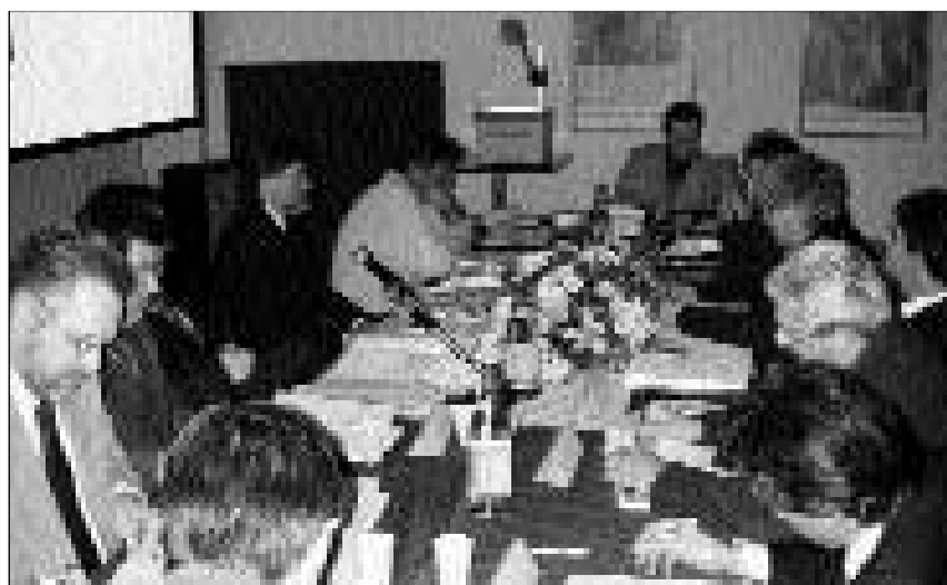
Vista en in lavuratori: Radund 80 participants han tractà dumondas da cultura, scola, linguistica, tradiziun e legislatura dals linguatgs furlan, ladin dolomitan e rumantsch.