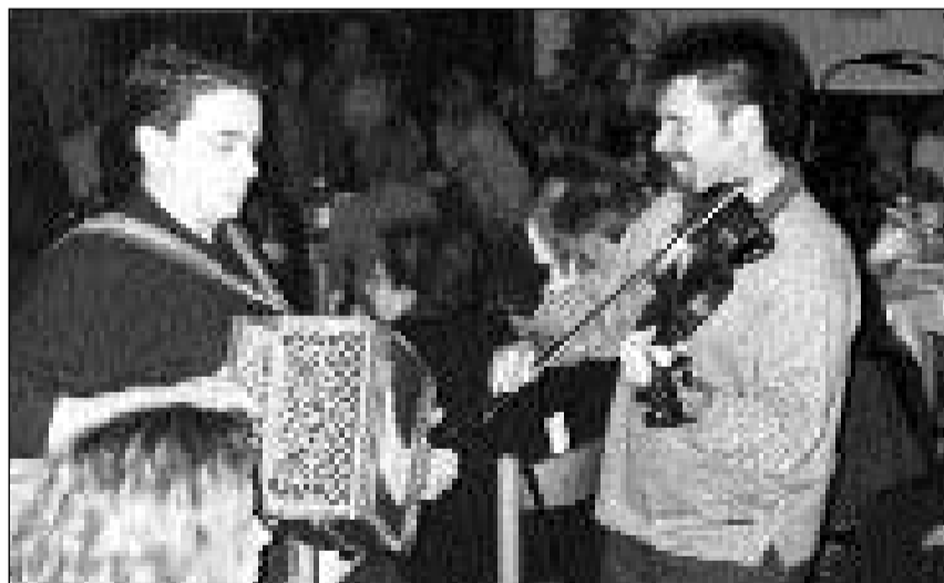
Armonica e violina èn instruments impurtants da la musica furlana. Ils dus musicists sin la foto èn interprets renomads dal Friaul.