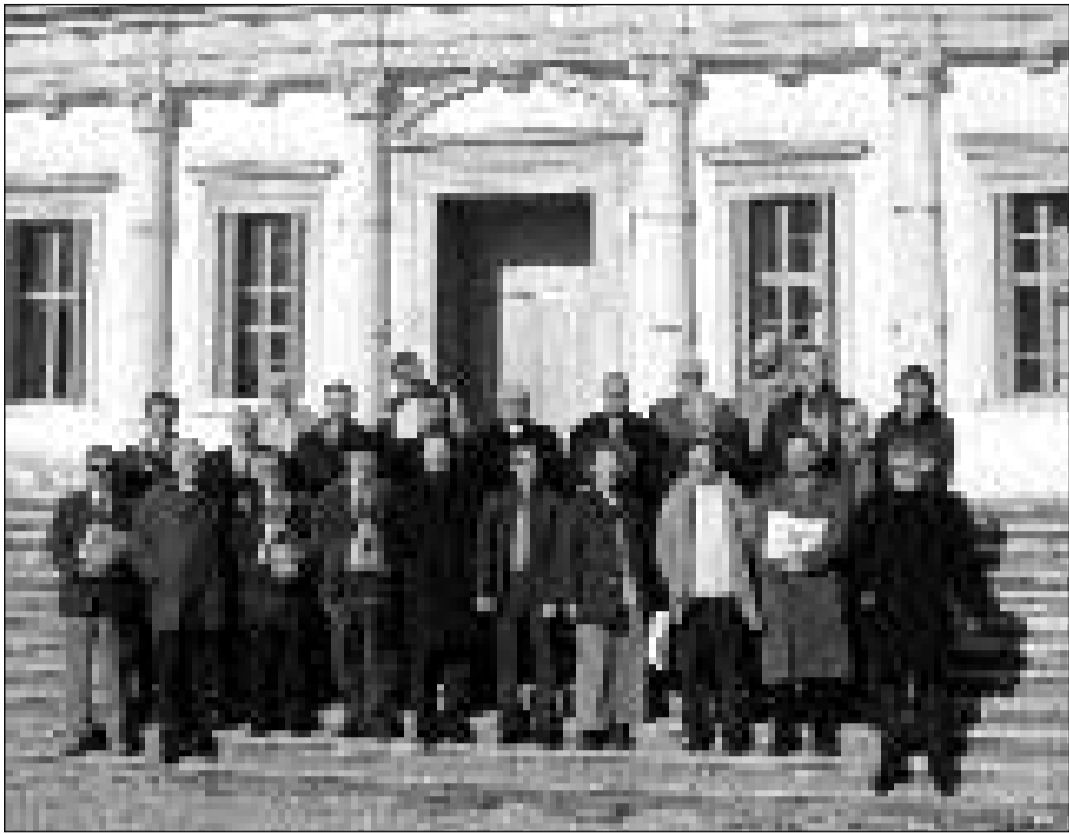
Autoritads e responsabels da Furlans, Ladins da las Dolomitas e Rumantschs davant la fatschada da la Villa Manin.