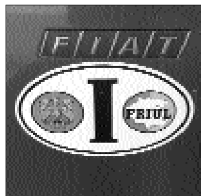
La lescha 482 dal 1999 ha sveglià il senn nazional dals Furlans.