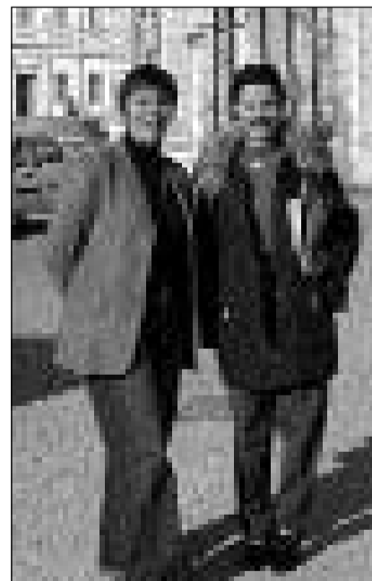
Duas organisaturas da l'Institut ladin-furlan «Pre Checo Placerean».