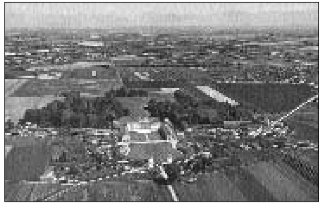
La Villa Manin a Codroipo è in dals bains culturals pli impurtants dal Friaul. Igl era pli baud la residenza da stad dals regents venezians.