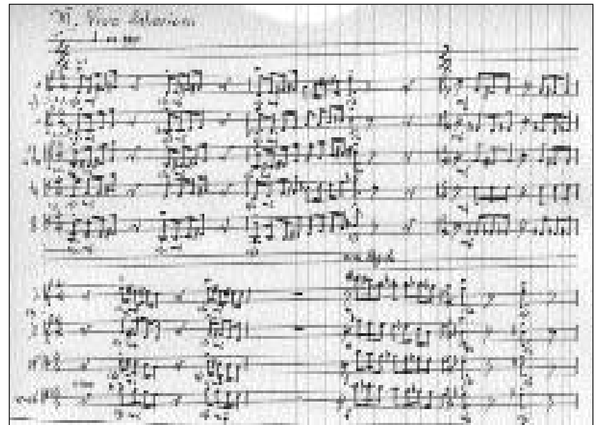
Copia partitura scret a maun.

Ha il success d'in toc pia da far cun emozziuns?