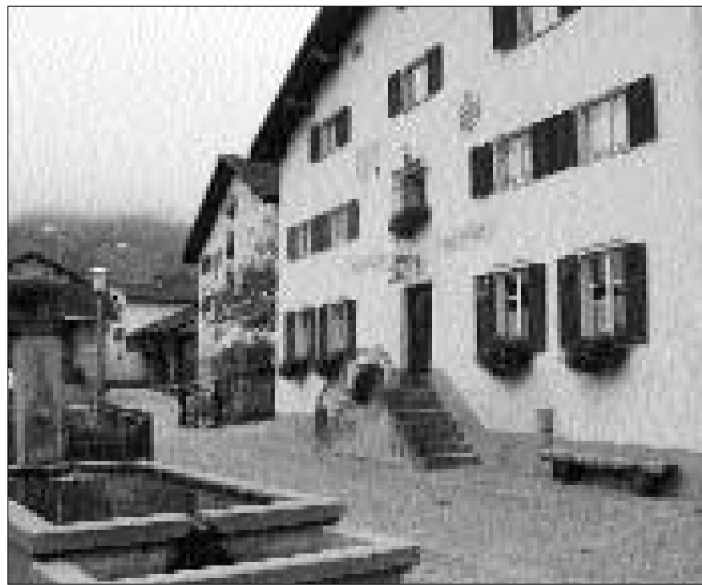
L'ustaria da Donat sa chatta en il center da la vischnanca.

Pauc toc davent aveva fabritgà l'onn avant l'enconuschent inschigner Robert Maillart la punt Val Tschiel. Da quel deriva er la punt sur la Salgina tranter Schiers e Schuders, construïda 1929/30. Onurada uffizialmain è quella vegnida il 1991. La punt da Salgina è in dals 22 monuments mundials, tar ils quals tutgan per exempel la tur Eiffel a Paris, la statua da libertad a New York u il chanal da Panama.