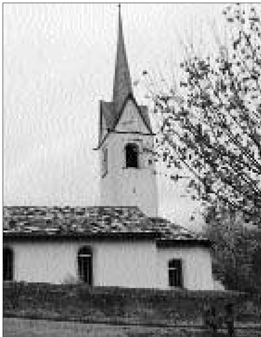
La baselgia da Donat deriva dal temp medieval.