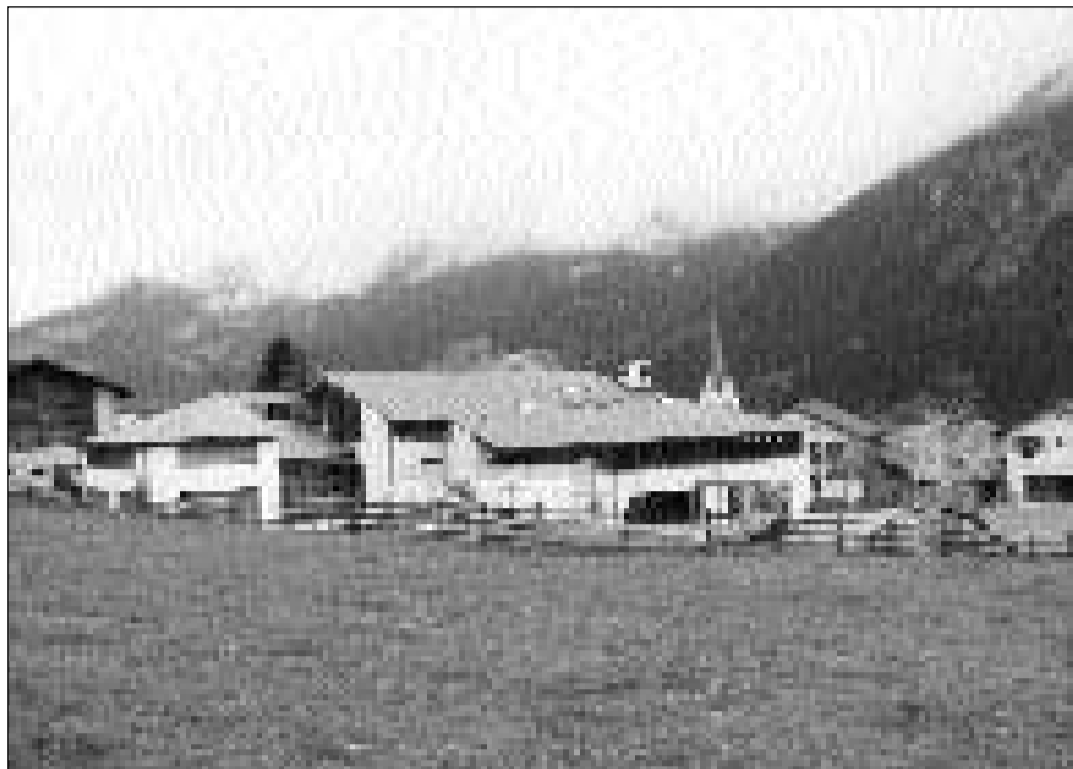
Entamez la vischnanca è l'unica scola primara sutsilvana.