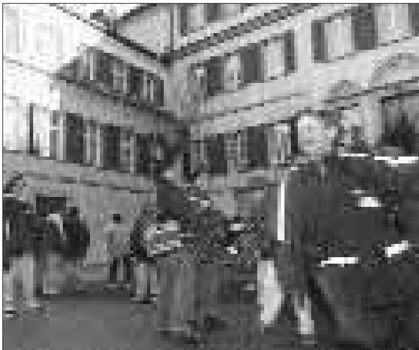
Lavurar, abitar, far cummissiuns, ir a scola ed er la vita en las uniuns na succedan gia daditg betg pli en in lieu, uschè che discussiuns da fusiun n'èn pli nagin tabu.

La definiziun d'ina grondezza ideala da vischnanca è oz dispuatavla. Tals criteris d'economia da manaschi che vulan fixar la grondezza ideala tar in tschert dumber d'abitants (p. ex. 3000) sa restrenschan per regla memia fitg sin ils custs administrativs. Er en il pli nov studi dal fondo nazional n'ha betg pudì vegnir constatada ina correlaziun tranter la grondezza da vischnanca e la capacitat. La grondezza suletta n'è anc nagin recept per avair success. La grondezza correcta sa resulta be da la funcziun da l'incumbensa ch'è d'ademplir. Per il Grischun cun las grondas differenzas topograficas, culturalas e linguisticas sto vegnir garantida pir da dretg la proporziunalitad. Betg mintga vischnanca ha exact las medemas incumbensas e na sto perquai insomma betg vegnir furnida egualmain en relaziun in sin in. Ultra da centers regionalas, centers turistics, valladas svilupadas armonicamain èn er imaginablas unitads pli pitschnas en tschertas regiuns periferas.