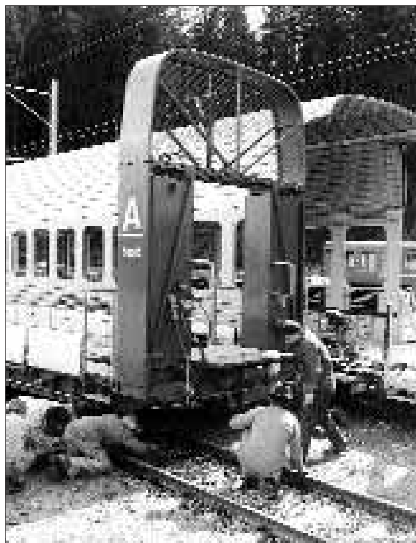
Ils lavurers exerciteschan gist tge ch'igl è da far en cas ch'in vagun sviescha. 10 novs posts da lavur porta il Vereina a Clastra.