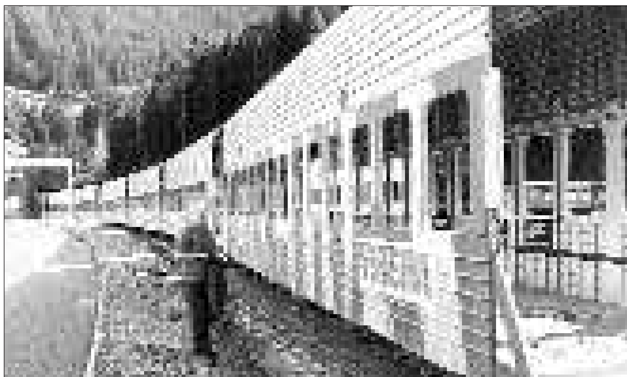
36 chars specials èn semtdags: Els pon chargiar autos da personas, bus ed autos da vitgira. Mintga mes'ura parta in tren cun autos vers l'Engiadina.