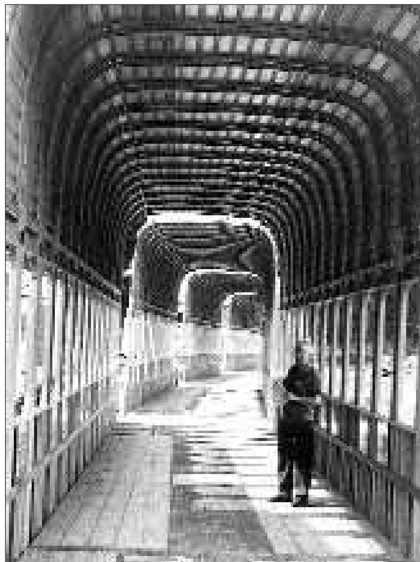
In tunnel en il tunnel: En l'intern dad in vagun per chargiar autos.