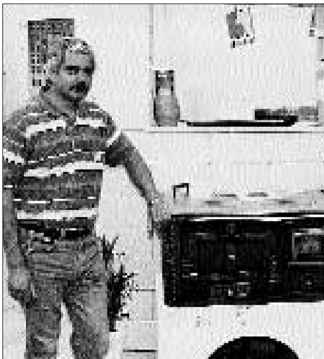
L'Associaziun grischuna dals tschentapignas-tschentaplattas: La platta da fiu renescha a nova vita.