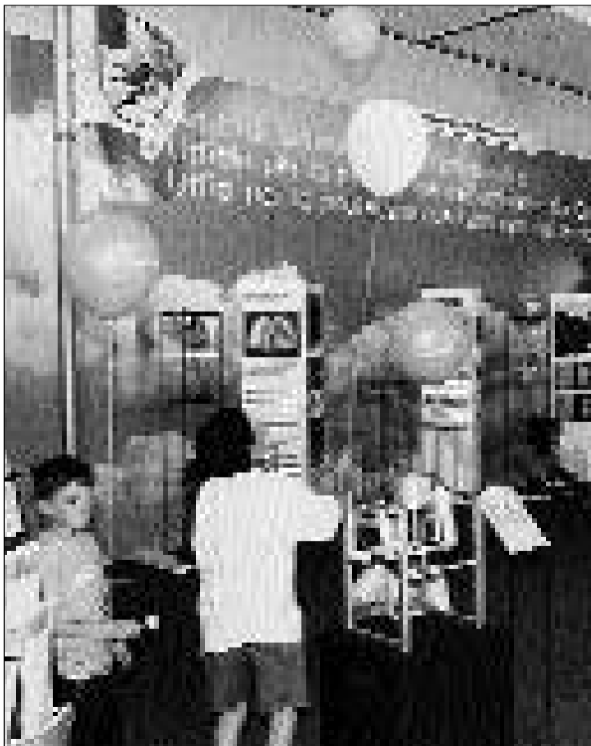
Las exposiziuns spezialas giudan ina bun'accoglientscha. En tge vaiderin pon ins savurar: Groffels, café, menta, tubac, vaniglia, citrona? Quai ha vuli savair l'Uffizi da la protecziun da l'ambient tar la «concurrenza da fufragnar».