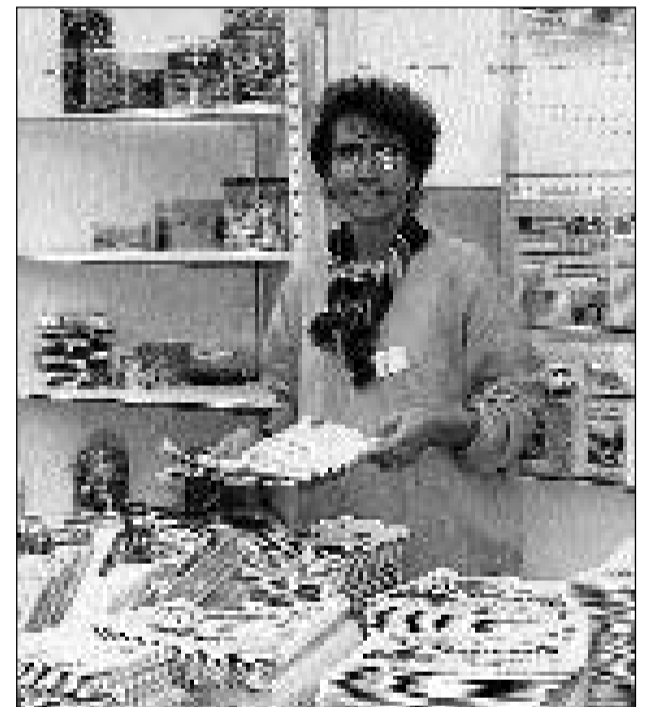
Sche ti vuls bain esser infurmà, legia La Quotidiana e ti pos restar a cha.