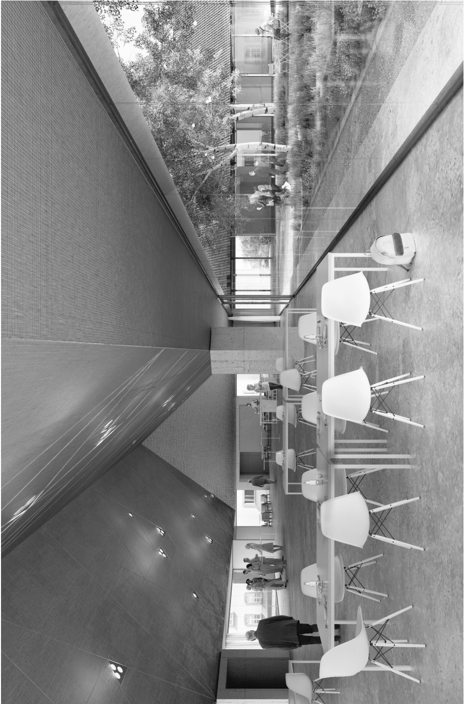
Vista interna da la sala futura (sguard en direcciun da la curt interna)