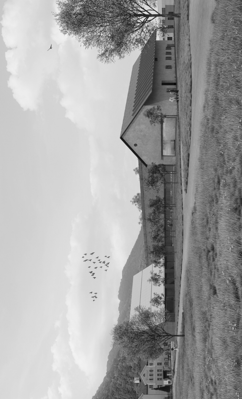
Il Plantahof cun l'edifizis administrativ existent, cun l'auditori Weber sco er cun la sala e cun la cuschina futura (da sanestra a dretga)