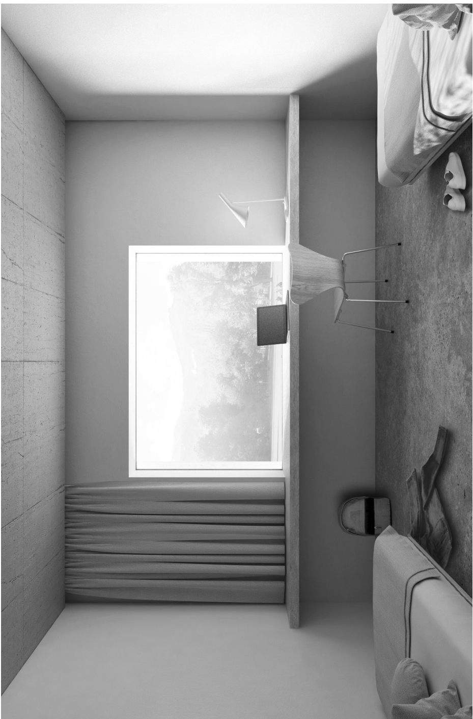
Vista d'una chombra da l'edifici d'alloschi nov